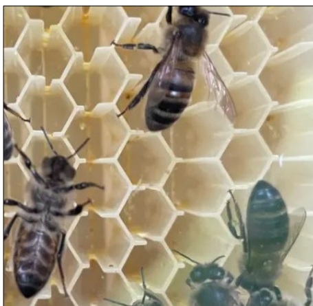
Plastikcellerne er klar til at blive fyldt op

bliver alle de lodrette lister forskubbet i forhold til hinanden. Cellerne åbnes derved i top og bund og honningen løber ned i bunden af plastiktavlen og kan tappes direkte ned i et glas eller en spand. Når tavlen er tømt for honning, drejes nøglen tilbage og cellerne er intakte igen. På ydersiden af tavlerne er voksforseglingen gået i stykker. Voksen fjernes af bierne, som hurtigt opdager at cellerne er tomme. Den bliver brugt andetsteds i stedet. Når cellerne igen er fyldt op, ja så forsegles de med voks på ny.