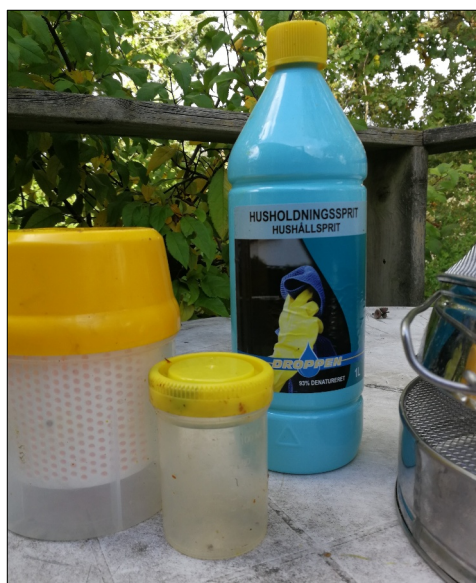
Vaskeriet: sprit, 1 dl. Bæger, easytjek vaskebeholder og en dobbeltsi.